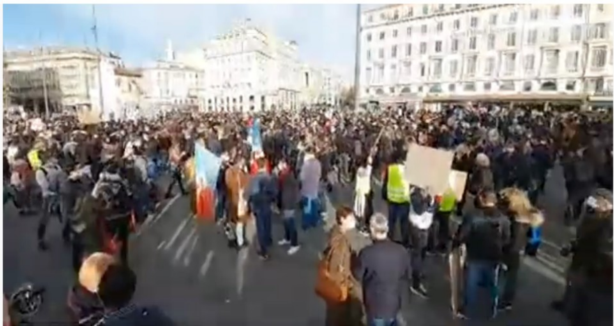
Manifestation Contre loi Sécurité Globale à Marseille

«Ça ne sert strictement à rien l'Europe, il faut sortir du carcan européen, reconstruire notre avenir, les peuples reconstruisent leur vies, déjà que moi je veux faire Sécession de cet État léviathan, de ces communistes, ces soviétiques... » (À partir de 1h01mn)